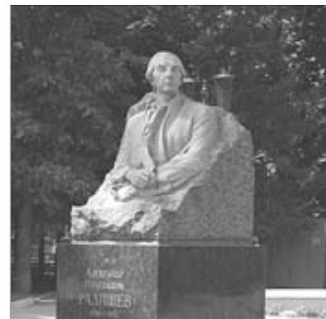
Одно из произведений А.П. Кибальникова

Скульптор А. Кибальников является одним из ярких и наиболее известных представителей современного монументального искусства. Его самобытный талант заслуживает искреннего уважения. Автор оставил в Саратове богатое культурное наследие — памятники, ставшие визитной карточкой региона: памятник Н.Г. Чернышевскому (у входа в парк «Липки»), А.Н. Радищеву (у основного корпуса Саратовского государственного художественного музея имени Радищева), памятник В.И. Ленину (на Театральной площади), писателю К.А. Федину (на ул. Октябрьской).