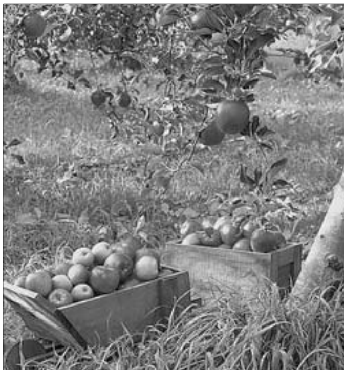
Яблоневые в сады стали символом возрождающейся экономики района

В рамках Дня предпринимателей Хвалынского района заявления на вступление в ТПП области подали около 30 организаций и индивидуальных предпринимателей.