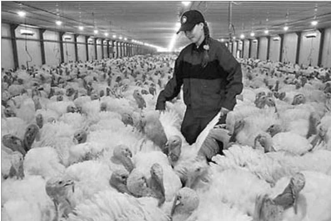
Планы «Евродона» так и остались на бумаге